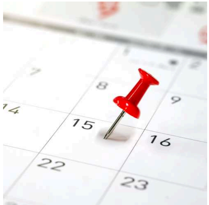
Termine & Veranstaltungen

Auf unserer Homepage finden Sie unter der laufend aktualisierten Rubrik Termine & Veranstaltungen alle Details zu den einzelnen Terminen und auch weitere Veranstaltungen rund um das Thema “Gesundheit im Betrieb” im Laufe des weiteren Jahres 2025.